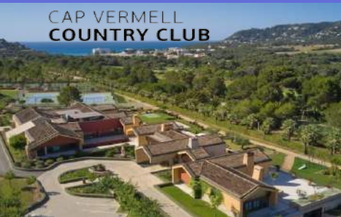
CAP VERMELL COUNTRY CLUB