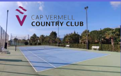
CAP VERMELL COUNTRY CLUB

Der Cap Vermell Country Club bietet Kurse wie Yoga, Pilates, Spinning an und verfügt über einen Serenita SPA mit Sauna, Erlebnisduschen und einen Vitality-Pool sowie ein 25 Meter Hallenbad.