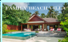
FAMILY BEACH VILLA