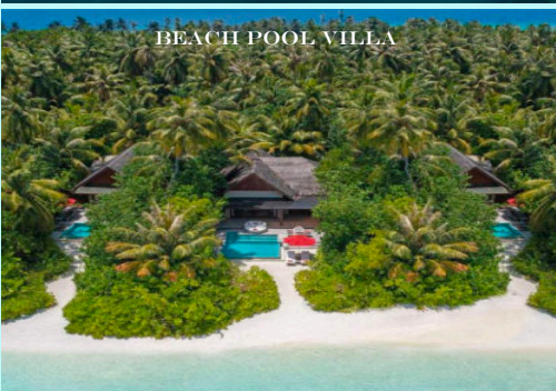
BEACH POOL VILLA